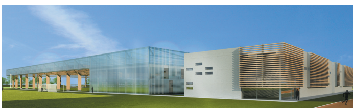
© Populous - Intens - Cité Groupe AIA / Buffi