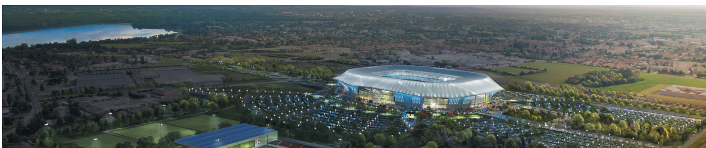
© Populous - Intens - Cité Groupe AIA / Buffi